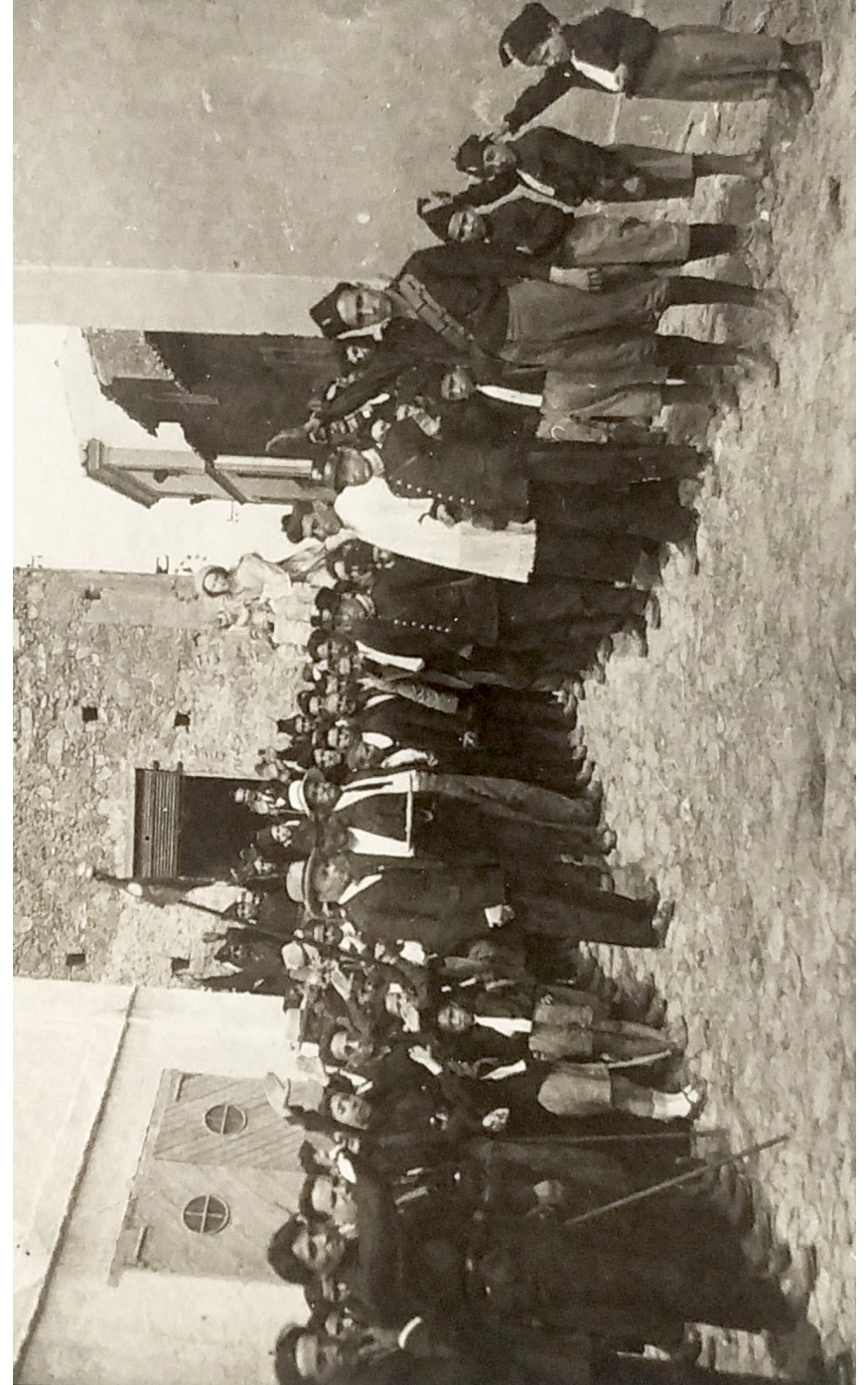
Badolato, piazza San Nicola, agosto 1935 - Saluto fascista durante la processione della statua della Madonna della Sanità.